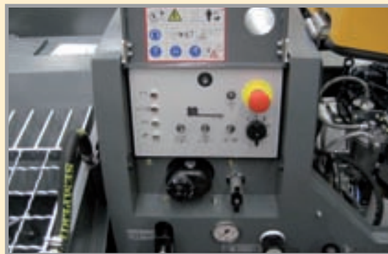
La SP 11 se controla desde el cuadro de mandos. La máquina cumple con los requisitos de la CE.