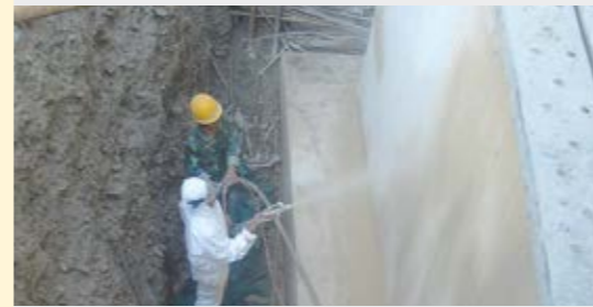
Revestimiento de cimientos de hormigón