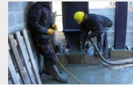
Rellenado de columnas de acero