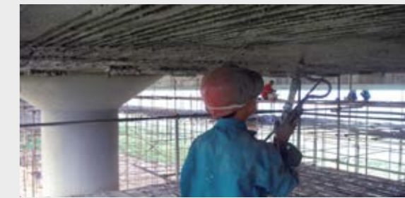
Saneamiento de puentes