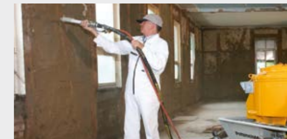
Enlucido de barro proyectado por pistola en interiores